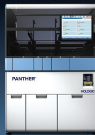
PANTHER® TMA a Ponto Final

As Soluções Expansíveis Panther® permitem expandir o menu de testes e, ao mesmo tempo, acrescentar flexibilidade, capacidade e tempo de autonomia.