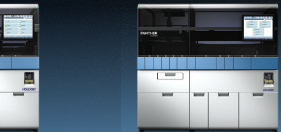
PANTHER® TMA em tempo real