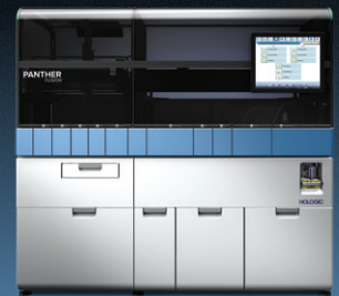
PANTHER FUSION® PCR em tempo real