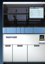
PANTHER® TMA a Ponto Final

A combinação perfeita. A automatização superior une-se ao desempenho de testes de excelência.