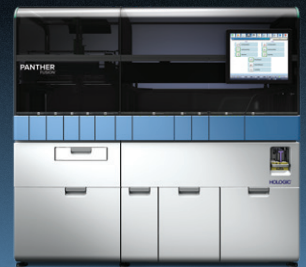
PANTHER FUSION® PCR em tempo real