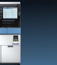
PANTHER® TMA em tempo real